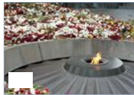
Genocidio armeno, a Yerevan il memoriale per non dimenticare