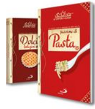
SAPORI DI CASA - 14 VOLUMI