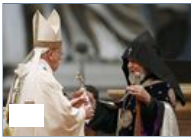
Le immagini della messa del Papa per gli armeni