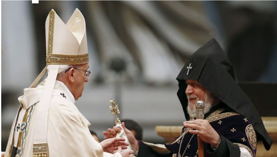
Le immagini della messa del Papa per gli armeni