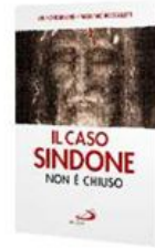
IL CASO SINDONE NON È CHIUSO