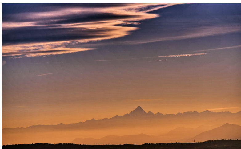
TRAMONTO SUL MONVISO